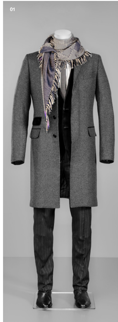
01 mantel, sakko, hemd, krawatte, hose d&g schal etro, schuhe prada l.r.

Zum gestreiften Hemd eine Krawatte mit auffälligem Muster? In dieser Saison ist der Material- und Mustermix nicht nur erlaubt, sondern absolut stylish und ein Muss.