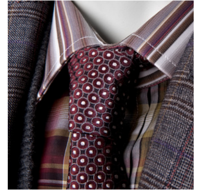
01 anzug, hemd, schal, jacke, handschuhe, alles etro schuhe prada l.r., krawatte z.zegna