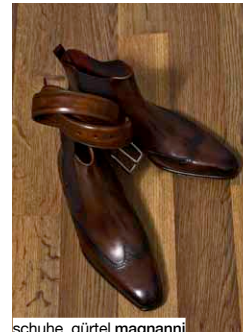
schuhe, gürtel magnanni