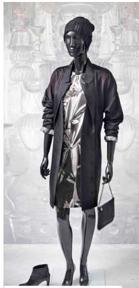
mütze diesel, schuhe prada, kleid, mantelkleid, tasche stella mc cartney