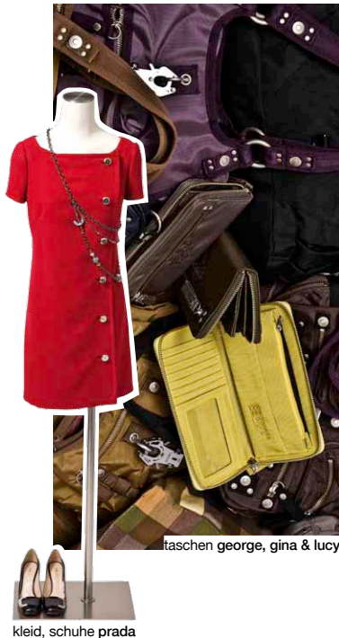
taschen george, gina & lucy

Dann kommen Sie zu Casa Moda und wählen Sie in gemütlicher Atmosphäre aus unserem Top-Mod Sortiment. Wir haben sicher das passende für Sie und Ihre Liebsten parat.