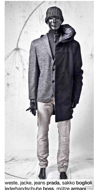
weste, jacke, jeans prada, sakko boglioli lederhandschuhe boss, mütze armani