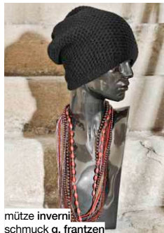
mütze invern schmuck g. frantzen